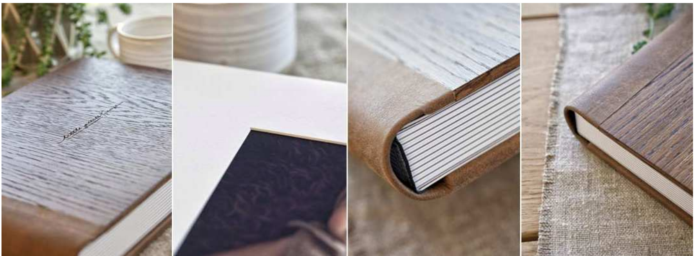
Livre luxe : ici bois de chêne et cuir véritable

Aussi, nous proposons de nombreuses possibilités de livres Luxes, fabriqués artisanalement en Italie. Nous nous ferons un plaisir de vous présenter ces bijoux qui utilisent cuir, bois de chêne, papiers italien etc... vous comprendrez que notre gamme luxe se différencie de notre gamme de livre standard plus industrielle par un détail encore plus raffiné.