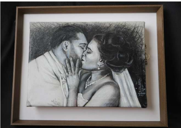
Petite toile suspendue Collection « Classique » (photo à gauche) : ici ce modèle artistique propose un dessin pastel gras sur toile. Le coffre se ferme à clé grâce à son cadenas cœur personnalisé.