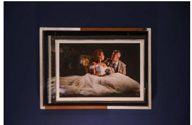
Petite toile suspendue « sans collection » (photo à droite) : photo sur toile, cadre indépendant suspendu avec des chaînes métalliques