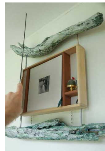
Livre étique 30x30 cm en 70 pages