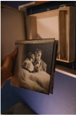
Livre 22x22 cm 30 pages rigides brillantes

Notre gamme standard de livre photographique est une gamme de qualité qui satisfera les exigences des amateurs des beaux objets : couverture simili cuir en 2 teintes ou plus en rapport avec les couleurs de votre mariage ; pages rigides brillantes ; possibilité de 1ere de couverture unis avec étiquette ou bien plexiglass ou bien couverture entièrement personnalisée. Les tailles sont différentes et les boites à livre suspendues seront adaptées et sur-mesure pour protéger ces livres.