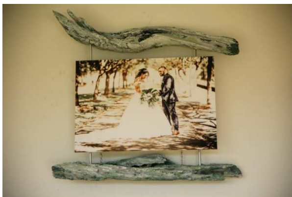
Grande Toile suspendue Collection Bois Flotté