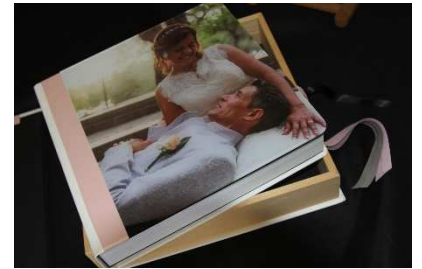
Livre 30x30 cm 70 pages rigides brillante

Aussi, nous proposons de nombreuses possibilités de livres Luxes, fabriqués artisanalement en Italie. Nous nous ferons un plaisir de vous présenter ces bijoux qui utilisent cuir, bois de chêne, papiers italien etc... vous comprendrez que notre gamme luxe se différencie de notre gamme de livre standard plus industrielle par un détail encore plus raffiné.