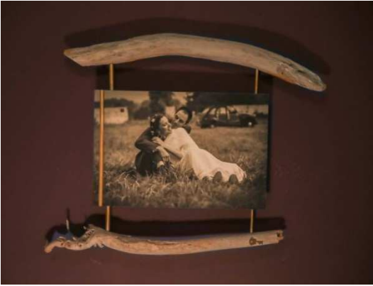
Petite toile suspendue Collection « Bois Flotté » (photo à gauche) : ici ce modèle propose une photo monochrome sur plaque métallique.

C'est un format de photo sur toile ou de photo sur plaque métallique ou bien des dessins sur toile, en 27x40 cm, avec leurs boîtes adaptées aux livres photo 22 X 22 cm, 30 ou 50 pages. Il est proposé en 2 collections différentes, la collection « classique » ainsi que la collection « bois flotté ». Il est possible aussi de vous proposer un encadrement personnel que l'on pourra définir ensemble, c'est la « sans collection ».