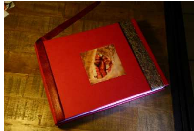
Livre 30x22 cm 50 pages rigides brillantes